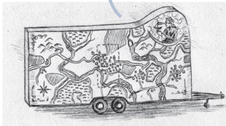
Illustration de Tristan Bordmann

Accepter de se perdre est parfois nécessaire pour retrouver des valeurs essentielles enfouies par la culture de masse flatteuse, abrutissante, mais aussi refuser l'uniformisation, renouer avec ses instincts vitaux : esprit critique, goût personnel, originalité. Pour oublier un temps les diktats sociaux, les trivialités quotidiennes qui empêchent souvent les beaux rêves de soi et la confiance dans l'autre, il faut se donner le droit à l'errance... Opérer un dérèglement magique de tous les sens, faire un saut dans l'inconscient pour trouver sa conscience.