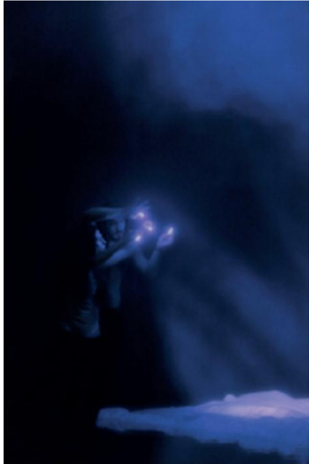
Burnout - 21 juillet 2019 - Festival d'Avignon Théâtre 11.Belleville Gilgamesh

'Le Poète se fait voyant par un long, immense et raisonné dérèglement de tous les sens.' A.Rimbaud, in lettre à Paul Demeny du 15 mai 1871, dite la lettre du voyant .